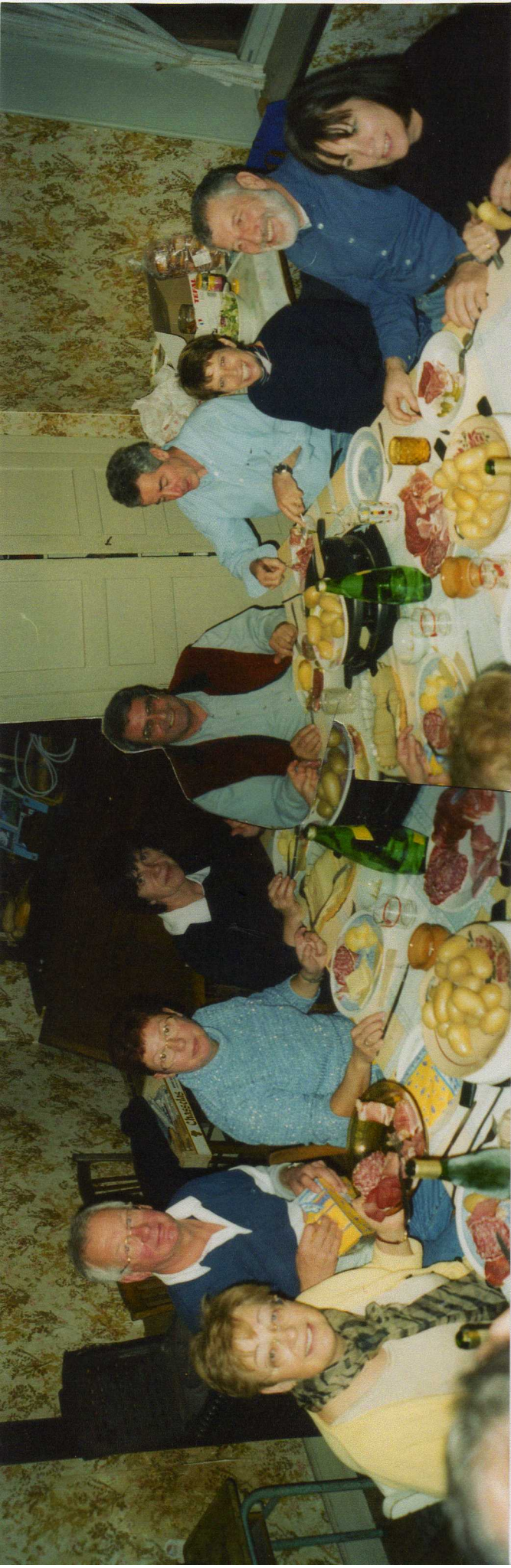
En attendant que le vin "dégongêfe", comment ne pas être de bonne humeur devant ces plats de confort mousillés.