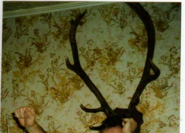
quand le vin est tiré, il faut le boire !